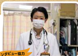
インタビュー協力