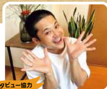
インタビュー協力