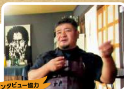
インタビュー協力