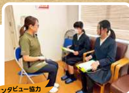
インタビュー協力