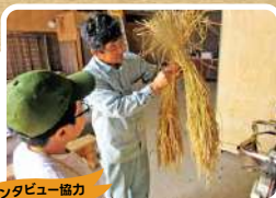
インタビュー協力