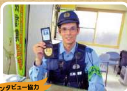
インタビュー協力