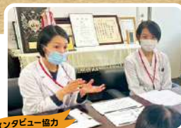
インタビュー協力