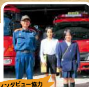
インタビュー協力