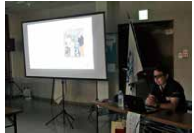
事前に㈱FORESTWORKER様をお招きし、林業についての事前講義を受け市長懇談会に臨みました。

庄原市の活性化の為に、市の情勢や動向を知り、活動することが非常に有効です。庄原市の行った事業、そのなかでも今回は林業と比婆牛について知ることで市の施策の理解を高めることが出来ました。特に林業については、循環型林業推進補助金を拡充するなどを入れていることなどから、重要な意味を持つことだと感じました。この知見を今後の事業にも生かして参ります!